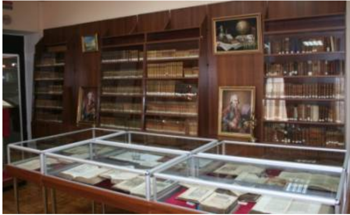
In den Hallen des Museums

Handschriften aus dem 16. bis 19. Jahrhundert, Hetman-Universalien, Einzelausgaben der Kosakenchroniken und der „Nischyn-Chronik“ aus dem 17. und 18. Jahrhundert, Autographen von Werken und Briefen des Schriftstellers M. W. Gogol usw. Leider wurden diese einzigartigen Handschriften und andere alte Drucke in den 1930er- bis 1950er-Jahren rücksichtslos aus Nischyn entfernt und befinden sich heute in den Sammlungen des Handschrifteninstituts der W.-Wernadski-Nationalbibliothek der Ukraine . Nationale Taras-Schewtschenko-Universität Kiew und andere wissenschaftliche Zentren der Ukraine.