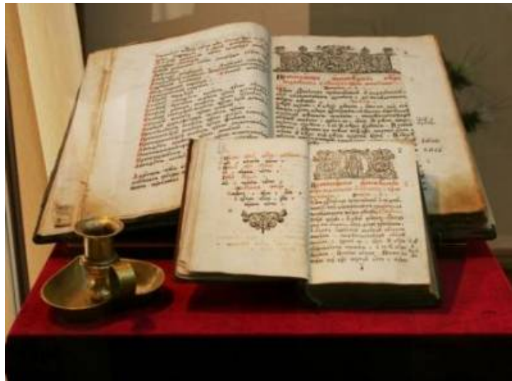
Ausschnitt aus der Museumsausstellung

Separate thematische Sektionen sind der französischen Literatur der Aufklärung des 18. Jahrhunderts gewidmet. Die prachtvollen Ausgaben von Werken Molières, Beaumarchais', Voltaires, Montesquieus und Helvetius' sowie das berühmte 30-bändige Lexikon von D'Alembert und Diderot aus dem Jahr 1751 beeindrucken durch ihre exquisite Gestaltung. Ukrainische Belletristik und Journalismus sind durch seltene Ausgaben von Werken von G. Skovoroda, I. Kotlyarevsky, G. Kvitka-Osnovyanenko, P. Kulish, M. Dragomanov, I. Nechuy-Levytsky, O. Konysky, M. Vovchka, L. Ukrainka und I. Frank vertreten . Einen Ehrenplatz in der Ausstellung nimmt selbstverständlich das Werk des herausragenden Nizhyner Schriftstellers Mykola Wassiljewitsch Gogol ein, dessen 200. Geburtstag die Ukraine in diesem Jahr feiert. Besonders hervorzuheben ist eine Auswahl an Werken von Taras Schewtschenko , insbesondere drei Ausgaben des „ Kobzar “ des großen ukrainischen Dichters: St. Petersburg 1867, Prag 1876 und Kiew 1918. Ein separater Ausstellungsbereich ist seltenen Ausgaben aus der Zeit des ukrainischen nationalen Befreiungskampfes und der Ukrainischen Volksrepublik von 1918–1920 gewidmet.