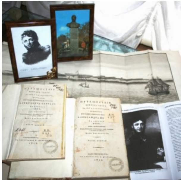
Die Ecke des Matrosen Yuri Lysyansky

Die wahren Schätze der Ausstellung sind die Bücher – Geschenke von Autoren und Verlegern. Die Universitätsbibliothek besitzt vermutlich als einzige in der Ukraine ein vollständiges Exemplar (zwei Bände und ein Atlas mit Illustrationen und Zeichnungen) des Buches „ Reise um die Welt “ des berühmten Seefahrers und Landsmanns aus Nischni Nowgorod, Juri Lysjanski . Dieser unternahm 1803–1806 zusammen mit I. Kruzenshtern auf den Schiffen „ Newa “ und „ Hoffnung “ die erste Weltumsegelung in der Geschichte des Russischen Reiches. 1825