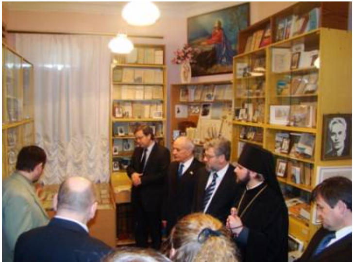
Während des Ausflugs